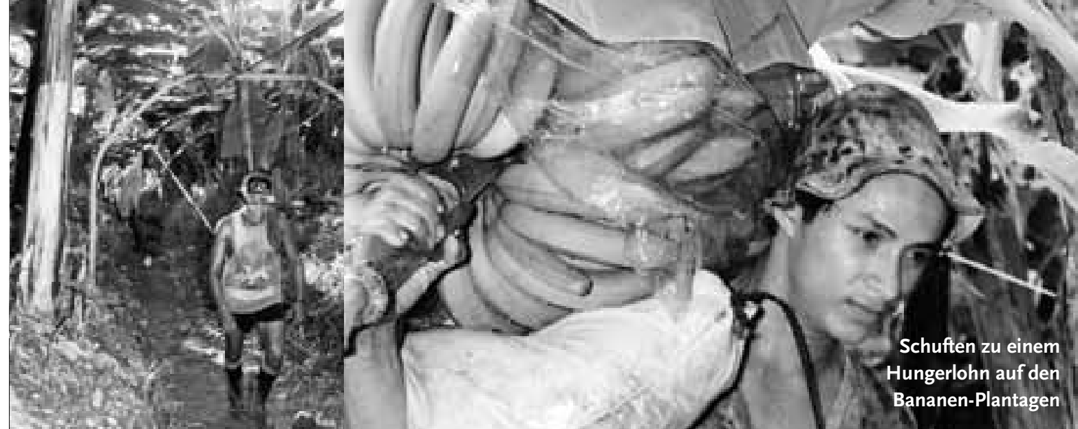
Schufteln zu einem Hungerlohn auf den Bananen-Plantagen